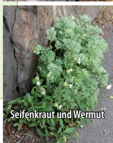
Seifenkraut und Wermut