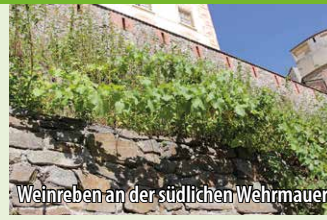
Weinreben an der südlichen Wehramauer