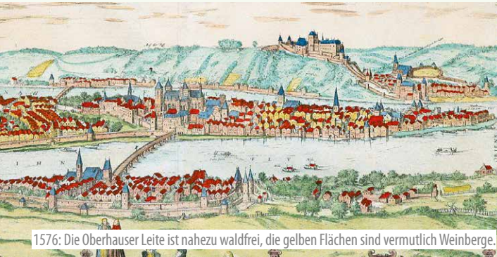
1576: Die Oberhauser Leite ist nahezu waldfrei, die gelben Flächen sind vermutlich Weinberge.

Auf dem Burgberg hielt man sich einst die Aussicht frei, damit sich niemand unbemerkt nähern konnte. Lediglich Baum- und Gebüschreihen sind auf alten Abbildungen erkennbar. Noch um 1900 hielten Weidetiere, besonders Ziegen, das Offenland gehölzfrei. Wo es Fels und Steilheit zuließen, baute man auch Nutzpflanzen an. Noch heute findet man Reste von Weinterrassen.