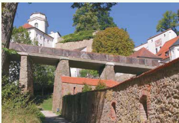
Blick vom nördlichen Wehgang in die Festungsanlage (von links: Aussichtsturm, Brücke zur Hauptburg, Jugendherberge)