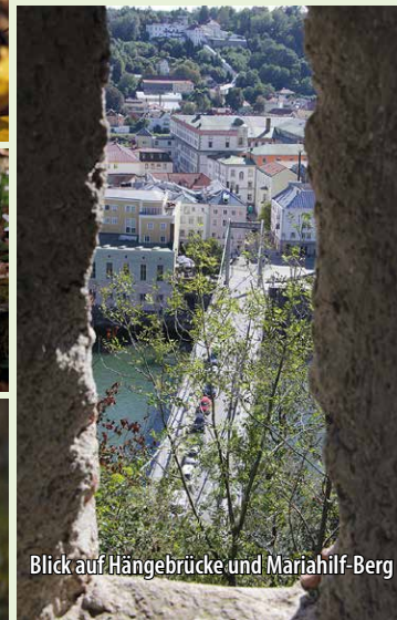
Blick auf Hängebrücke und Mariahilf-Berg