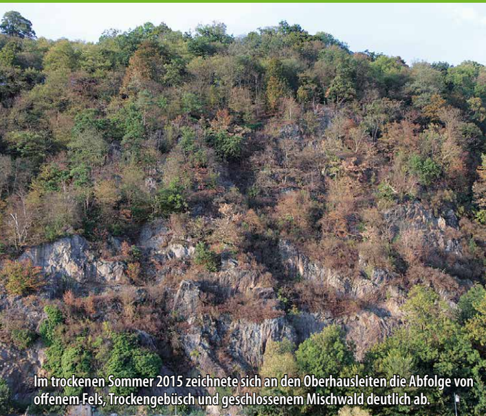
Im trockenen Sommer 2015 zeichnete sich an den Oberhausleiten die Abfolge von offenem Fels, Trockengebüsch und geschlossenem Mischwald deutlich ab.