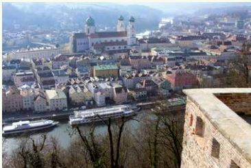
Altstadt-Panorama von der Aussichtskanzel neben dem Restaurant Oberhaus