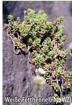
Weißer Fetthenne