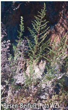
Besen-Beifuß (Foto WZ)