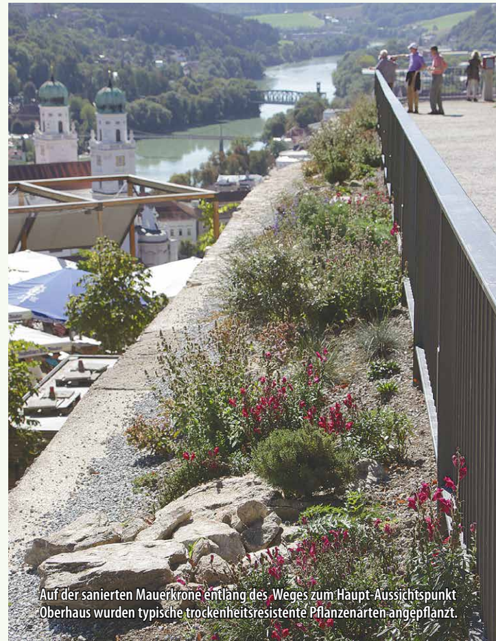
Auf der sanierten Mauerkrone entlang des Weges zum Haupt-Aussichtspunkt Oberhaus wurden typische trockenheitsresistente Pflanzenarten angepflanzt.