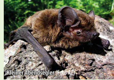
Kleiner Abendsegler

Die Leitenwälder sind beliebtes Jagdrevier für Fledermäuse. Von der Dämmerung bis in die ersten Morgenstunden orten sie mit Schallwellen größere Insekten. Den Tag verbringen sie in Baumhöhlen oder ausgetragenen Fledermauskästen. Über 10 Arten wurden hier schon nachgewiesen.