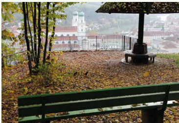
Aussichtsplatz „Pilz“ mit Blick auf den Dom Sankt Stephan