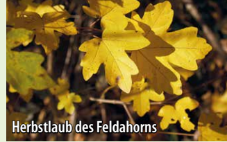
Herbstlaub des Feldahorns