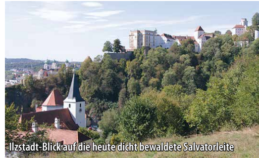
Ilzstadt-Blick auf die heute dicht bewaldete Salvatorleite