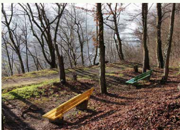
Ruhebänke in der Oberhauser Leite hoch über dem Donautal