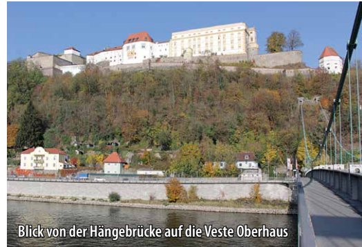
Blick von der Hängebrücke auf die Veste Oberhaus

Die Donau, ein länderverbindender Strom, und der kleine Bayerwaldfluss Ilz formten an ihrem Zusammenfluss den imposanten Georgsberg, auf dem 1219 die Veste Oberhaus gegründet wurde. Die alten Wehranlagen ziehen sich den abfallenden Bergsporn zwischen den beiden Flusstälern hinab und finden dort, wo sich Ilz und Donau vereinigen, in der Veste Niederhaus ihren Abschluss. Diese von Flusswasser umspülte Trutzburg ist heute in Privatbesitz und im Gegensatz zum Oberhaus nicht öffentlich zugänglich.