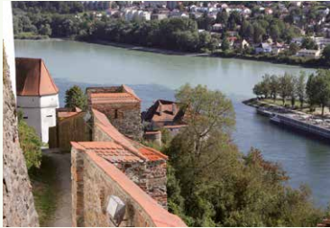
Südlicher Wehgang mit Ausblick auf die Ortspitze von Passau (Zusammenfluss von Donau und Inn)