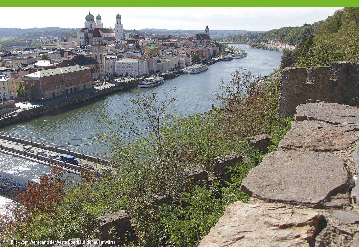
Blick vom Wehrgang der Veste Oberhaus donauaufwärts