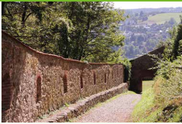
Nördlicher Wehgang mit Blick Richtung Donautal