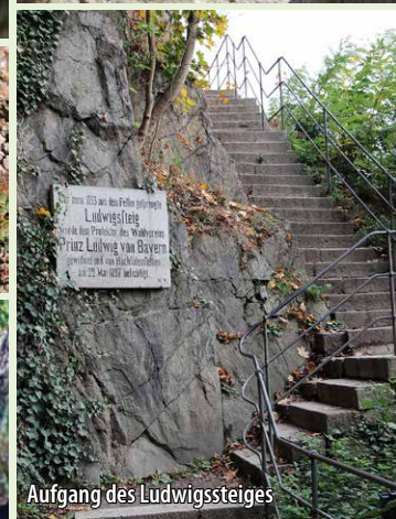
Aufgang des Ludwigssteiges